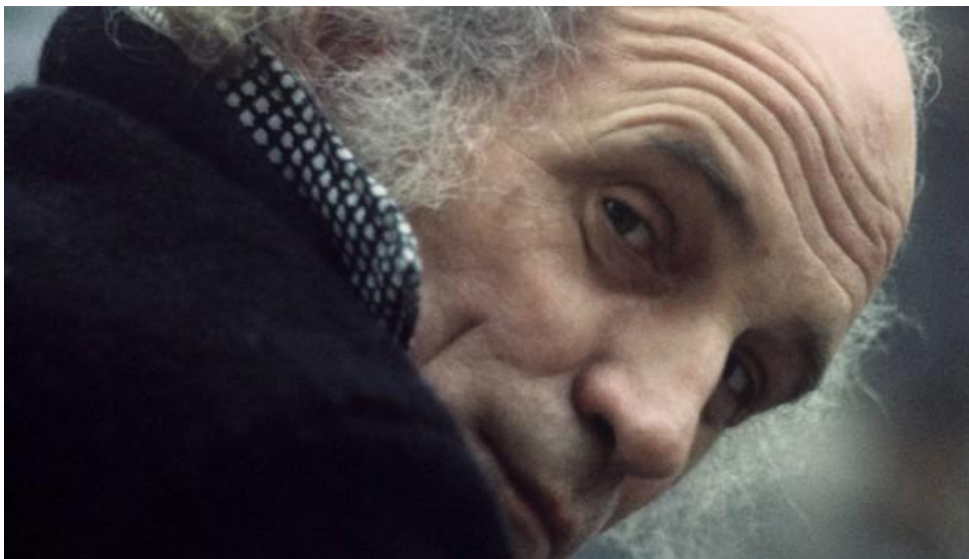
Léo Ferré en 1975 en Italie.

Remplissez les mots manquants dans cette chanson de Léo Ferré.